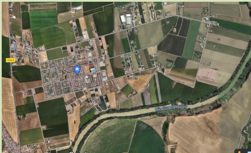
Mapa de Encinarejo y alrededores